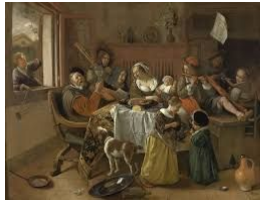
Vrolijk huisgezin – Jan Steen