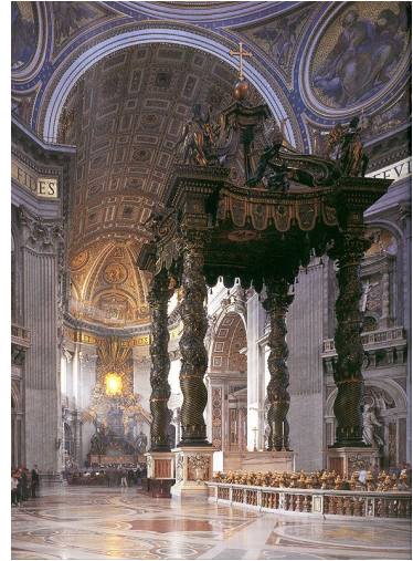
Het Baldakijn – Bernini