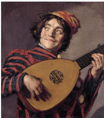
Luitspelende nar – Frans Hals