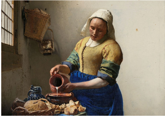
Het melkmeisje - Johannes Vermeer