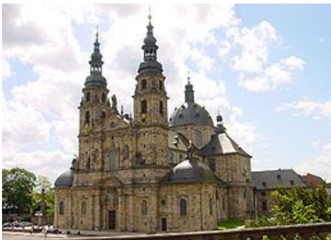
Dom van Fulda